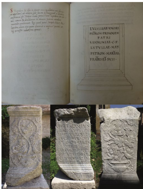
Fig. 2. L'ara funeraria di C. Petronius Gemellus (CIL V, 5444) nei Collectanea di Benedetto Giovio (BCCo ms. 1.3.20, 59v-60f) e nella sua attuale collocazione presso il Museo Civico di Castiglione Olona.

della sua famiglia, tutti cittadini romani: sua moglie Viria Lucilia (figlia di un L. Virius , probabile notevole milanese), i suoi genitori, C. Petronius Primigenius e Sammonia Lutulla , suo fratello Petronius Martialis ed altri eventuali parenti.