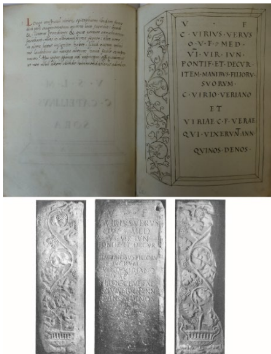
Fig. 4. La stele funeraria di C. Virius Verus (CIL V, 5445) nei Collectanea di Benedetto Giovio (BCCo ms. 1.3.20, 61v-62f) e in Crivelli, Atlante , cit., p. 81, fig. 207–209. L'attuale collocazione della stele non consente di scattare fotografie altrettanto accurate.

pontificato), lo fece realizzare per sé e per i defunti figli, C. Virius Verianus e Viria Vera , verosimilmente gemelli morti nelle stesse circostanze.