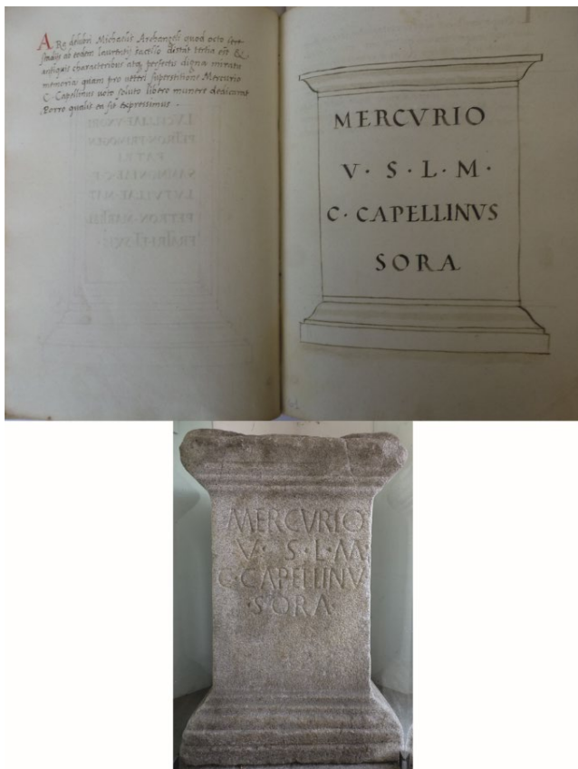
Fig. 3. L'ara votiva dedicata a Mercurio da C. Capellinus Sora (CIL V, 5442) nei Collectanea di Benedetto Giovio (BCCo ms. 1.3.20, 60v-61f) e nella sua attuale collocazione presso la casa comunale di Stabio.